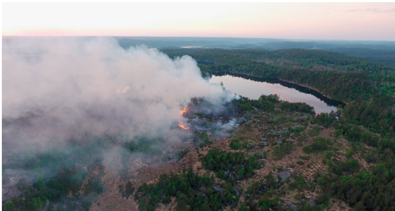
Iglekärr, Ale kommun 2019-05-22

En händelse som stack ut medialt och organisatoriskt var utsläppet av ammoniak vid Ale arena. Händelsen inträffade i ett skede när vi som organisation var som hårdast belastad med skogsbränder och semestern var i full gång vilket gör organisationen mindre uthållig avseende inkallande av extra personal. Det nyligen inrättade samverkansavtalet med räddningstjänstorganisationerna inom Göteborgsregionen sattes på prov för första gången med mycket gott resultat vilket borgar för en fortsatt utveckling mot en gemensam ledningsstruktur.