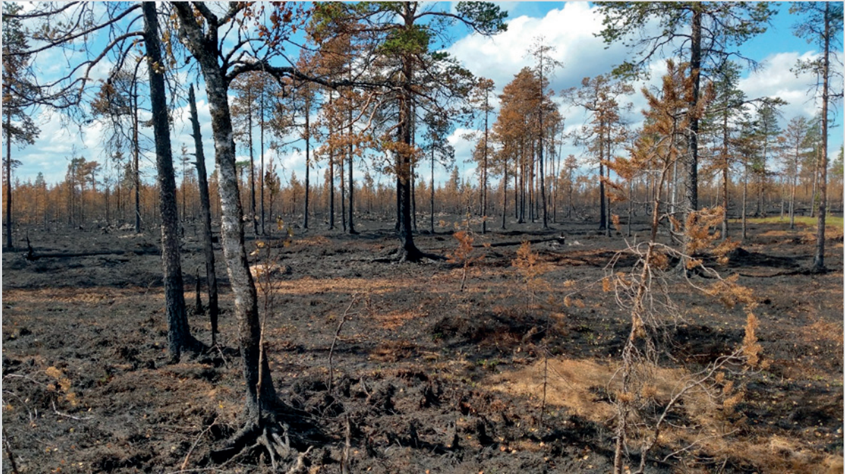
En av sommarens alla skogsbränder 2018.