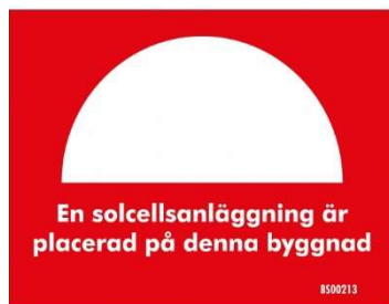
Figur 1. Exempel på skyltning av solcellsanläggning (SEK handbok 457)