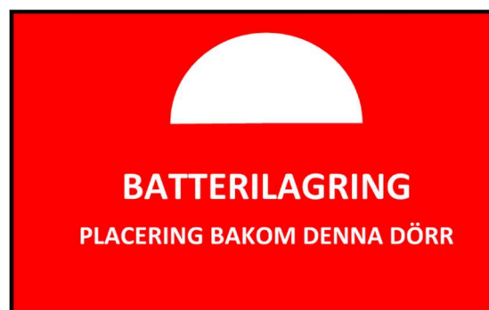
Figur 3. Exempel på skyltning av batterilagring