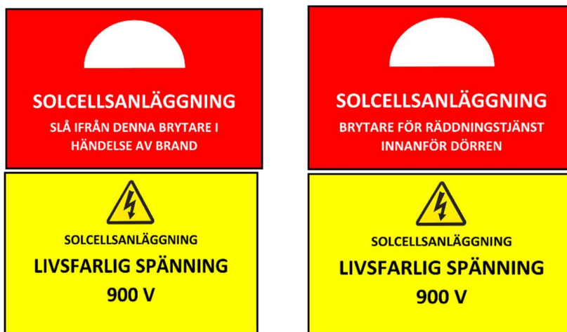
Figur 2. Ytterligare exempel på skyltning