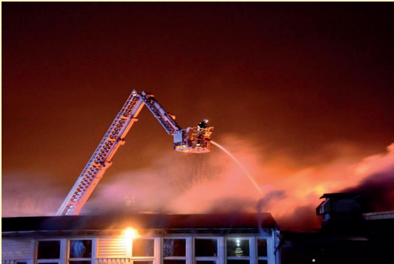
Räddningsarbetet med Thorildskolan 29 april 2017.