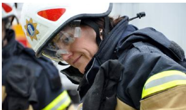
RAP - Ren arbetsplats och rena yrkeskläder.

Förbundet utför ovanstående uppgifter genom att bryta ner uppdraget i mål och prestationer vilka dokumenteras och följs upp i en verksamhetsplan.