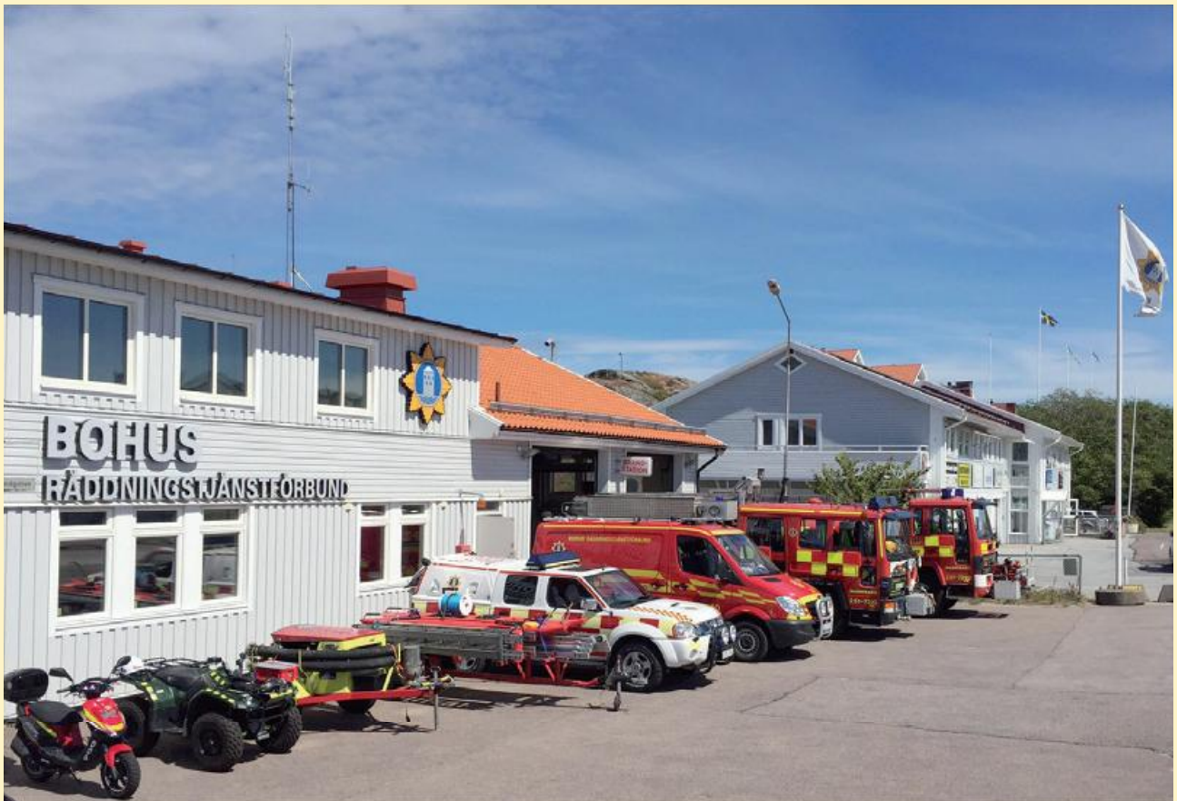
Marstrands brandstation (Köön)