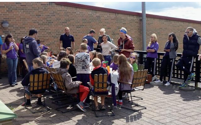
De vitryska barnen är på sitt årliga studiebesök på Kungälv's brandstation med traditionsenlig korvgrillning.

Förbundet har även 2015 varit i arbete med att nå ut till ungdomar för att skapa en god relation samt verka proaktivt i hopp om att detta skall resultera i minskade antal olyckor.