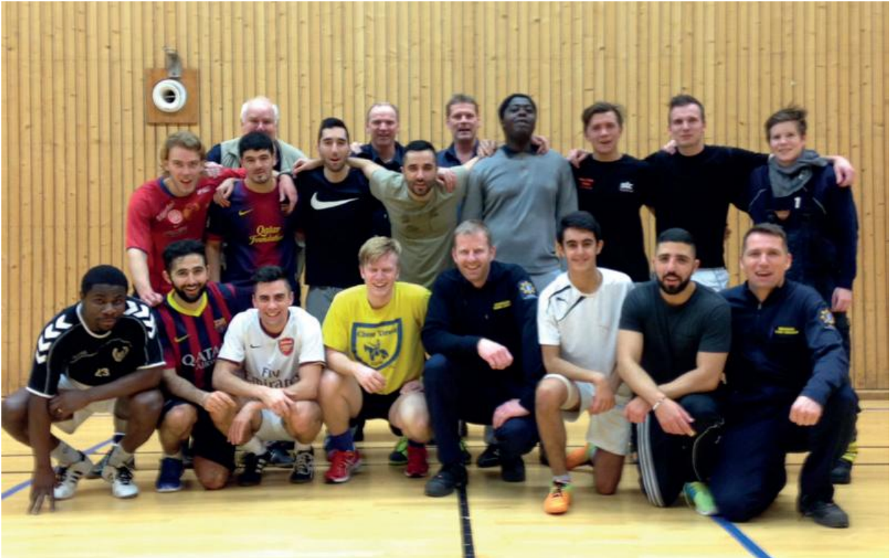
Gemensam träning med FC Komarken.

Förutom ett administrativt deltagande i olika grupper så arbetar förbundet mycket med att möta ungdomarna. Förbundet är bland annat aktiva med att besöka fritidsgårdar samt stödja och delta i idrottsevenemang. Att tillsammans med ungdomarna planera för trygga och säkra miljöer i anslutning till helgdagar/långhelger/skollov och övriga evenemang är en självklarhet i det dagliga förebyggande arbetet. Förbundet har även bjudit in ungdomar till brandstationerna för att vid dessa tillfällen informera, utbilda samt knyta goda relationer.