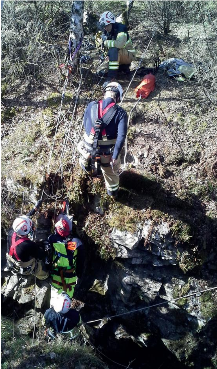
Livräddningsövning i svår terräng.