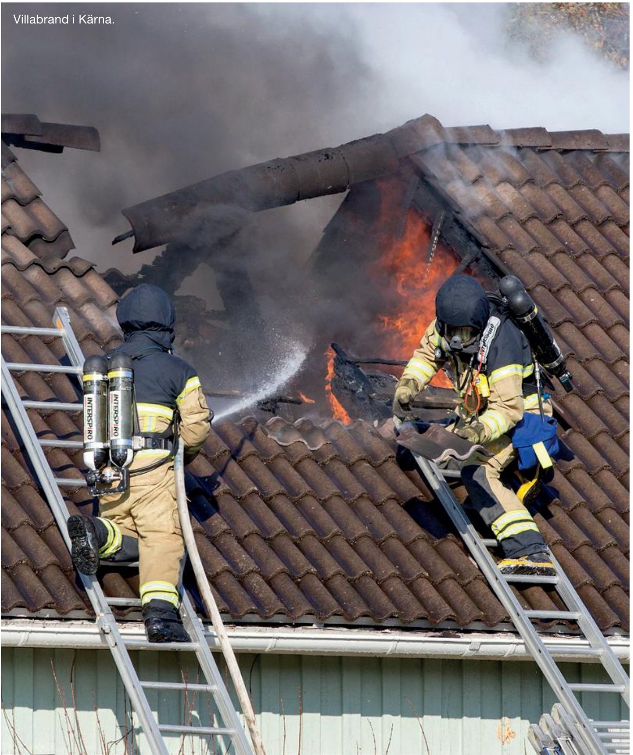
Villabrand i Kärna.